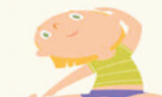
SEATED SIDE POSE