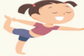
LORD OF THE DANCE POSE