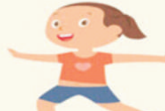
WARRIOR 2 POSE